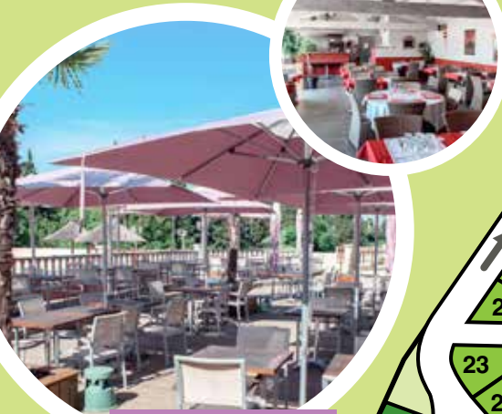
RESTAURANT BAR - GLACIER